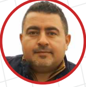
Ejder Yücel Hun Education Macaristan