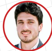
Trojan Braha DID Deutsch Institut